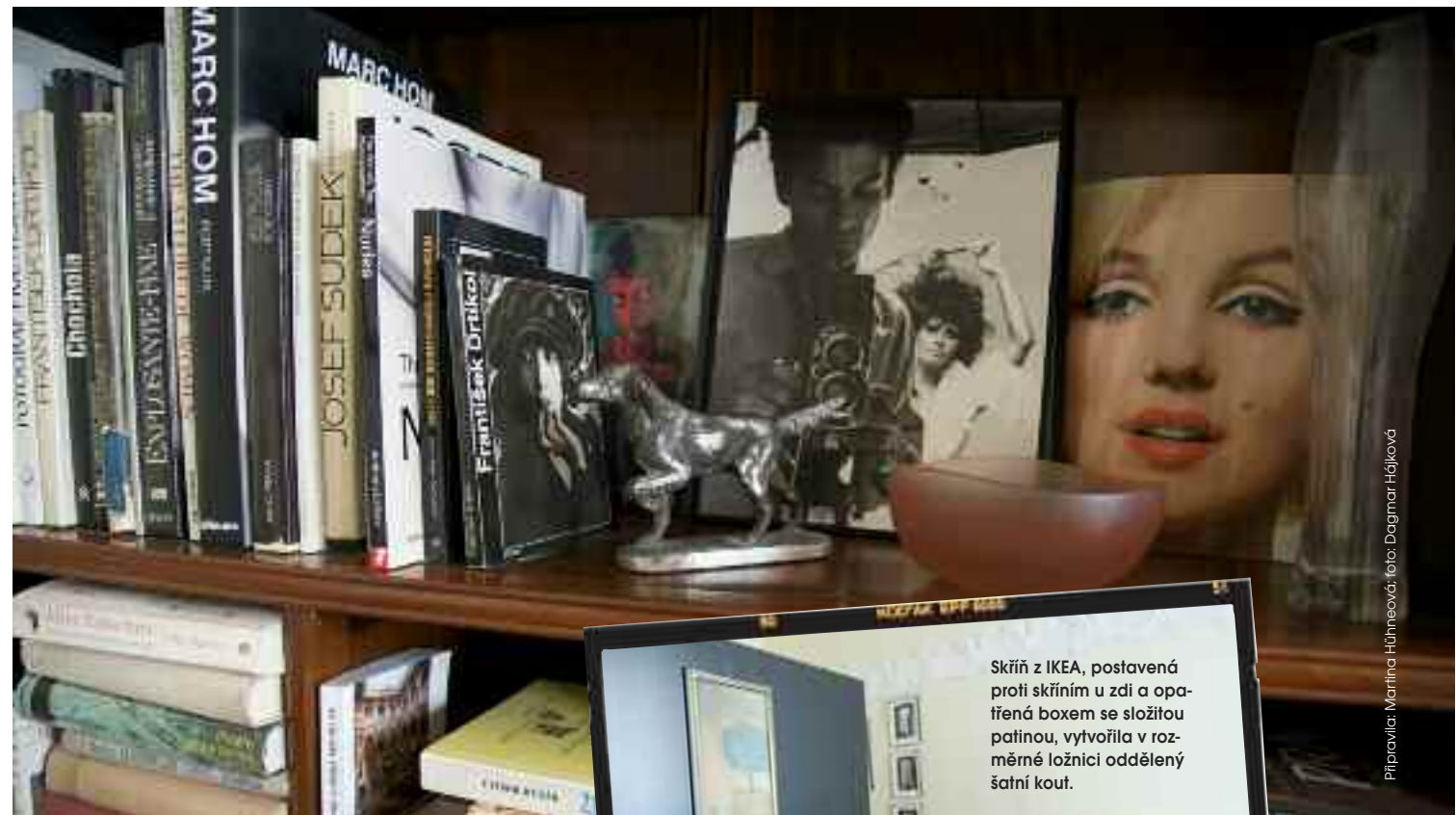
Připravila: Martina Hůhneová

Vášeň obyvatel pro fotografii, architekturu, literaturu, výtvarné umění a vše krásné prozrazují v bytě nejen knihy v objemné knihovně, která pokrývá celou jednu stěnu velkého obývacího pokoje.