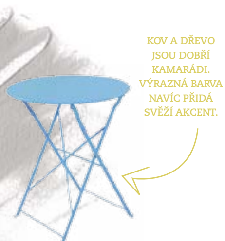
KOV A DŘEVO JSOU DOBRÍ KAMARÁDI. VÝRAZNÁ BARVA NAVÍC PŘIDÁ SVĚŽÍ AKCENT.

Venkovní lampa 9769, Redo, plast, v. 70 cm, Ø 20 cm, Svet-svitidel.cz, 1761 Kč; protiskluzná dlažba Shade Ghiaccio, Pastorelli, mrazuvzdorná keramika, 40×2×80 cm, Eshop.obkladyvilimek.cz, 2439 Kč/m 2 ; terasové prkno Garapa hladká, garapa, 458×2,1×14,5 cm, 1546 Kč, Ceskestavebniny.eu; venkovní křeslo Alizé, barva 14-Nutmeg, hliník, textilie, 68×104×88 cm, cena k doptání, skládací stůl Bistro, kov, v. 74 cm, Ø 60 cm, 4590 Kč, obojí Fermob, Eshop.lepatio.cz